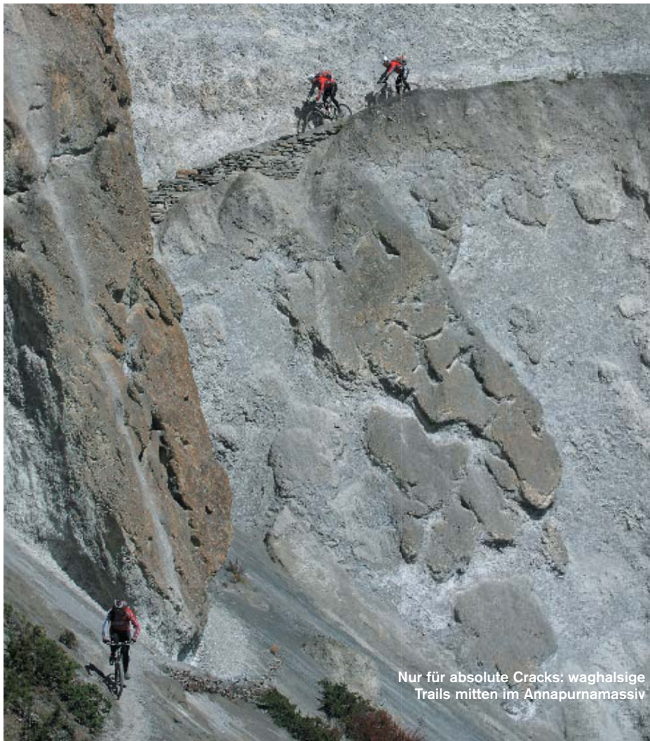
Nur für absolute Cracks: waghalsige Trails mitten im Annapurnamassiv