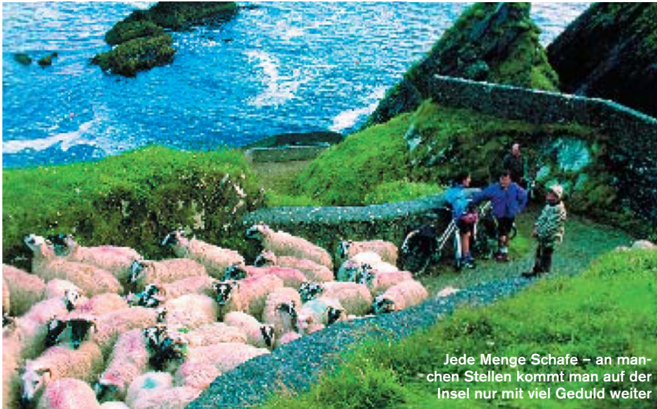
Jede Menge Schafe – an manchen Stellen kommt man auf der Insel nur mit viel Geduld weiter