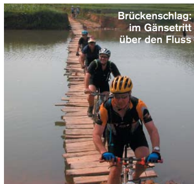
Brückenschlag: im Gänsetritt über den Fluss

Angebot Alpin Travel GmbH, Tel. 0041/81/7 20 21 21 ( www.alpintravel.ch ). 14 Tage 1575 Euro pro Person inklusive Inlandflug nach Saigon, Übernachtungen, Verpflegung, Guide. Eigene Anreise und eigenes Fahrrad.