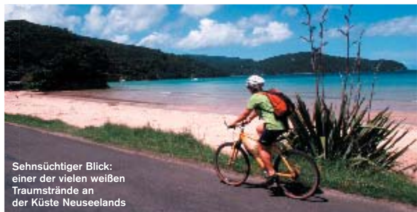
Sehnsüchtiger Blick: einer der vielen weißen Traumstrände an der Küste Neuseelands

Reise Die 15-tägige Offroad-Tour führt über die Südninsel und entlang ihrer rauen Westküste – durch sattgrünen Regenwald bis an den Rand mächtiger Gletscher. Der Trip beginnt in Christchurch, danach radelt die Truppe über den Danseys Pass (1140 Höhenmeter) bis nach Chatto Creek. Am achten Tag ist Stopp